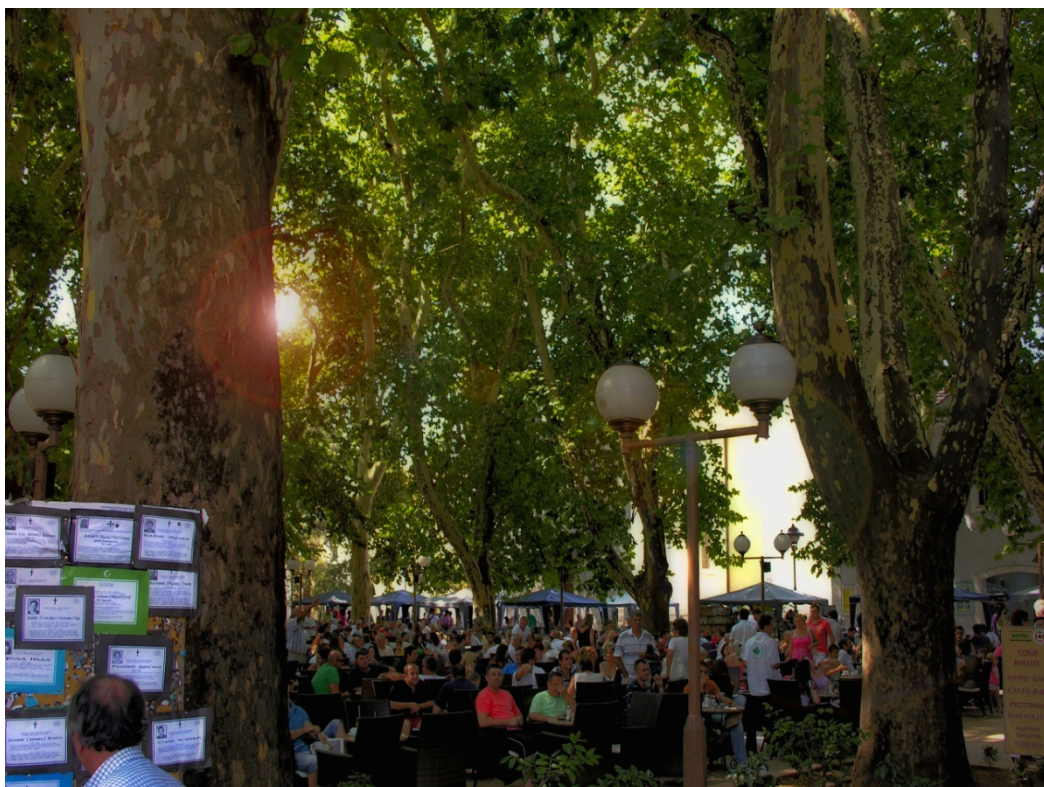
Mŕtvi a živí