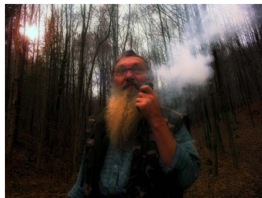
Muž s fajkou