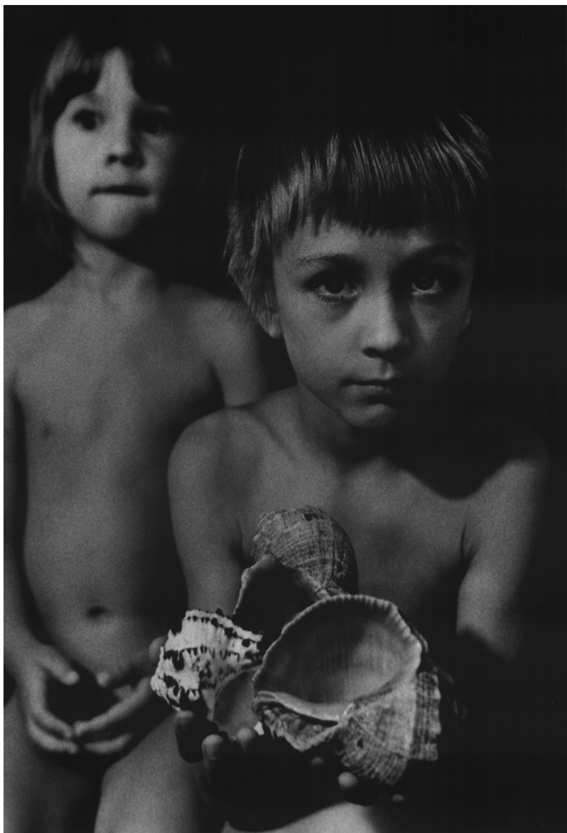
Spomienka na leto