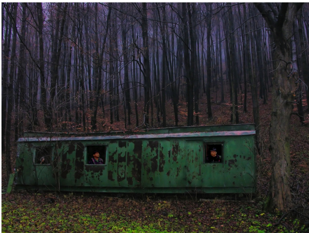
Lovecká sezóna 1