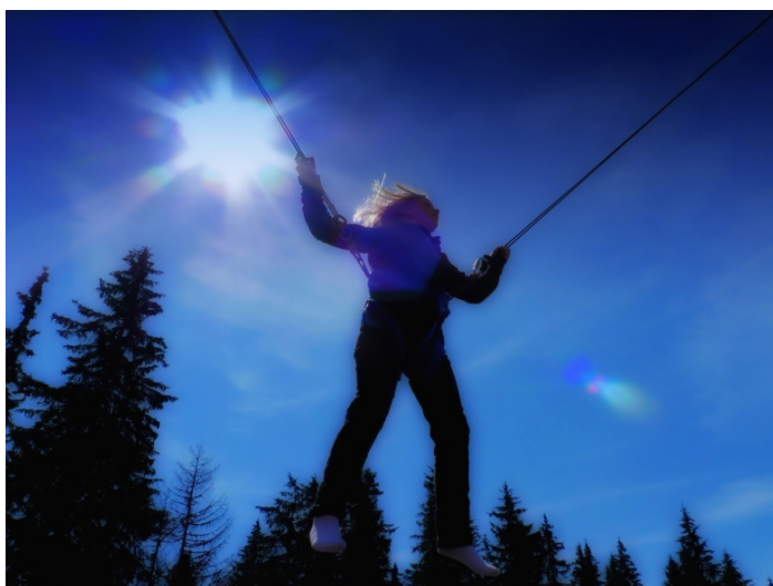
Bližšie k slnku 2